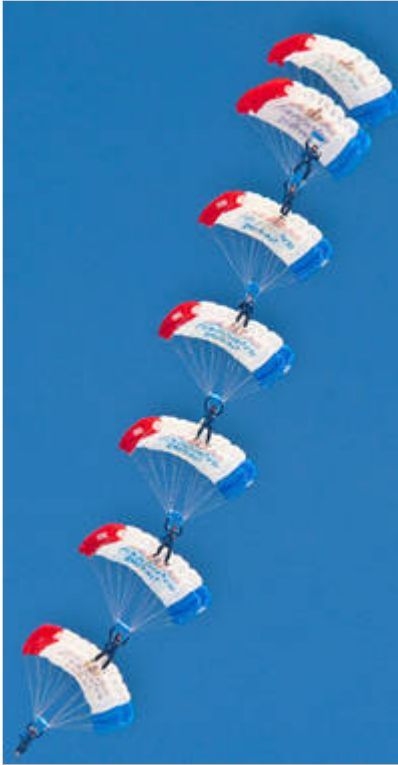
Das FF-Team gastiert am 4. und 5. September beim Flugplatzfest der Fliegergruppe Plettenberg-Herscheid.