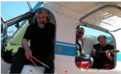
Flugplatzfest Die Plettenberger Band Mash spielt auf

Sonntag bietet sich die Möglichkeit, die Angebote von Märkischer Museumseisenbahn (Kartoffelfest) und der Aktion „Hüinghausen unter Dampf“ in der Rammerghalle mit dem Flugplatzfest zu verbinden. Ein Shuttledienst macht's möglich, dass das Auto am Bahnhof Seissenschmidt in Köbbinghausen abgestellt werden kann; per Bahn und Planwagen der Schlepperfreunde geht's weiter.